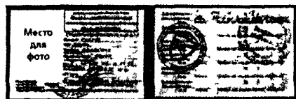
при оформлении в билетных кассах и пригородных поездах

Для оформления абонементного билета дополнительно предоставляется именной электронный носитель «Карта учащегося».