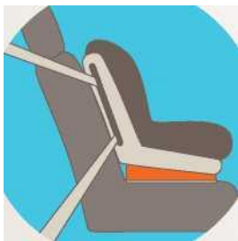
Лицом по ходу движения

Самое безопасное место для установки детского кресла в автомобиле - среднее место на заднем сиденье. Самое небезопасное - переднее пассажирское сиденье и на него автокресло ставится в крайнем случае, при обязательно отключенной подушке безопасности.