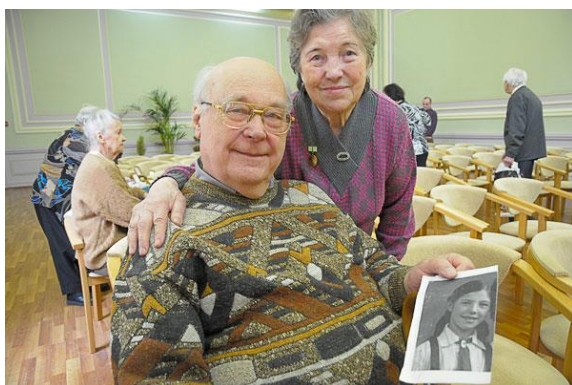
Уроки Памяти, фото из Интернета, 2010г.