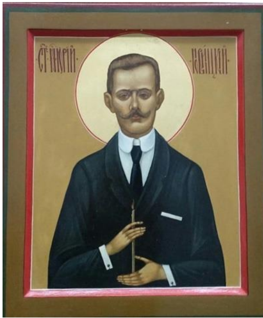
Новомученик Юрий Новицкий