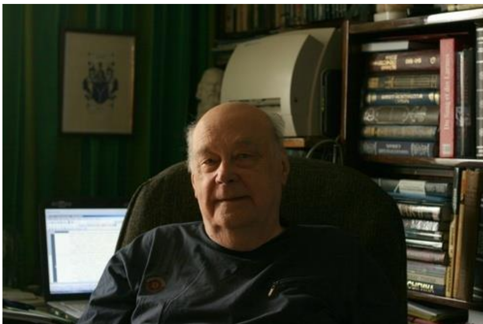
Ю.И.Колосов в домашнем рабочем кабинете