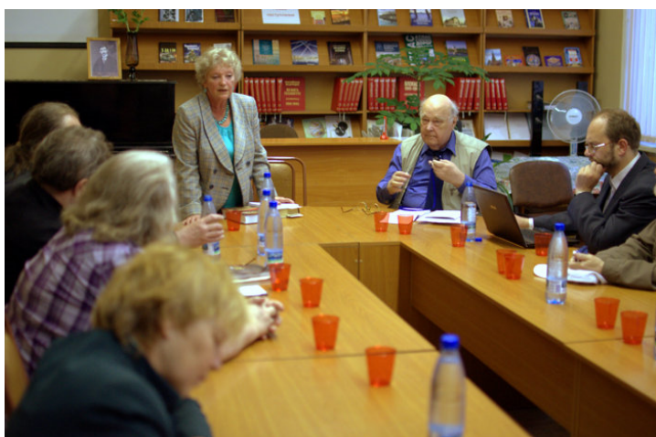
Вечер, посвященный 90-летию гибели митрополита Вениамина Петроградского и с ним убиенных, 13.08.2012