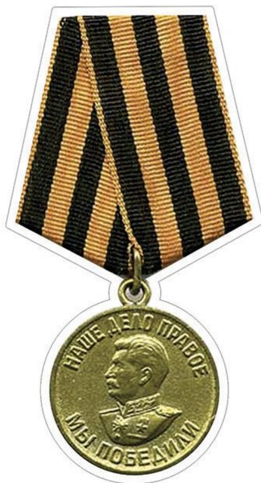
Медаль « За победу над Германией»