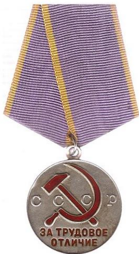
Медаль «За трудовое отличие»