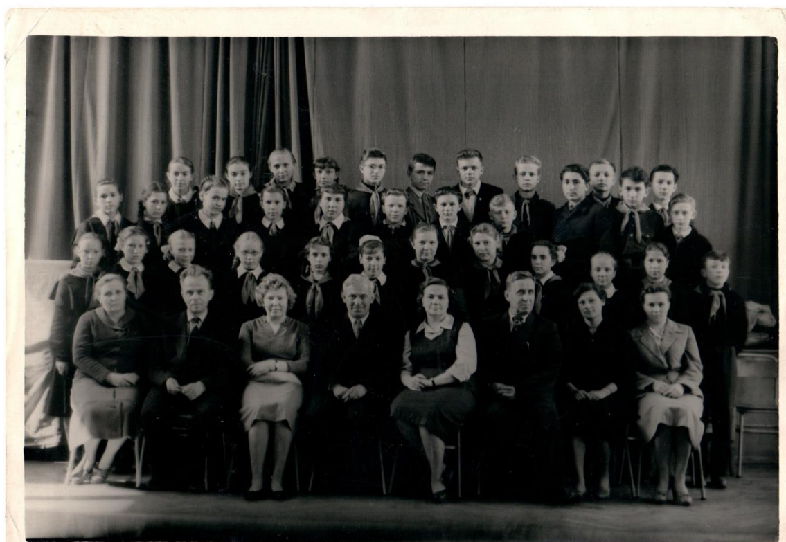
Школьное фото 1961 год