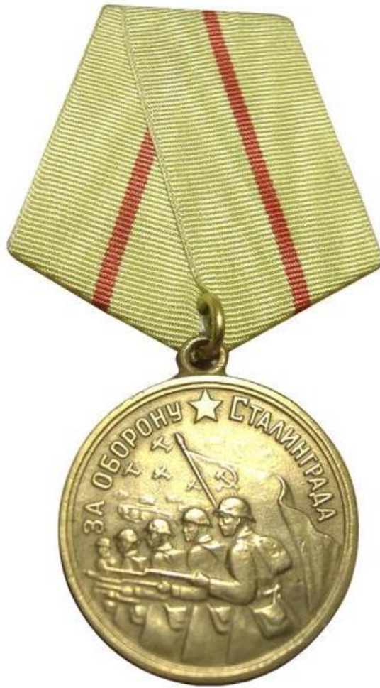
медаль «За оборону Ленинграда»