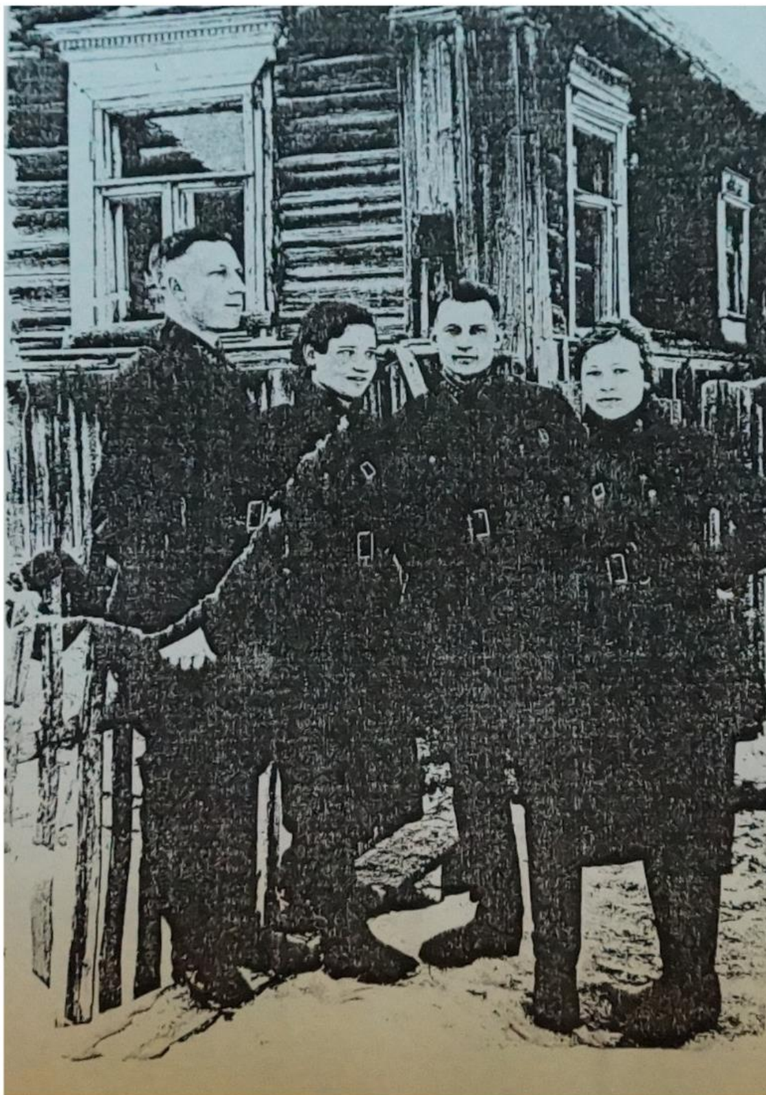
. Село Никольское Зима 1942года