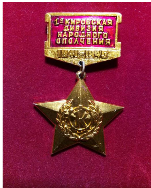
10. Знак участника 1 – ой Кировской дивизии народного ополчения.