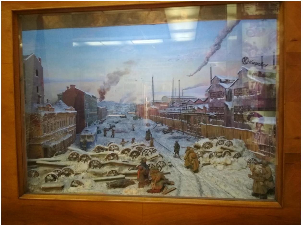
7. Диорама в музее Кировского завода. Фотография сделана во время экскурсии в музей.