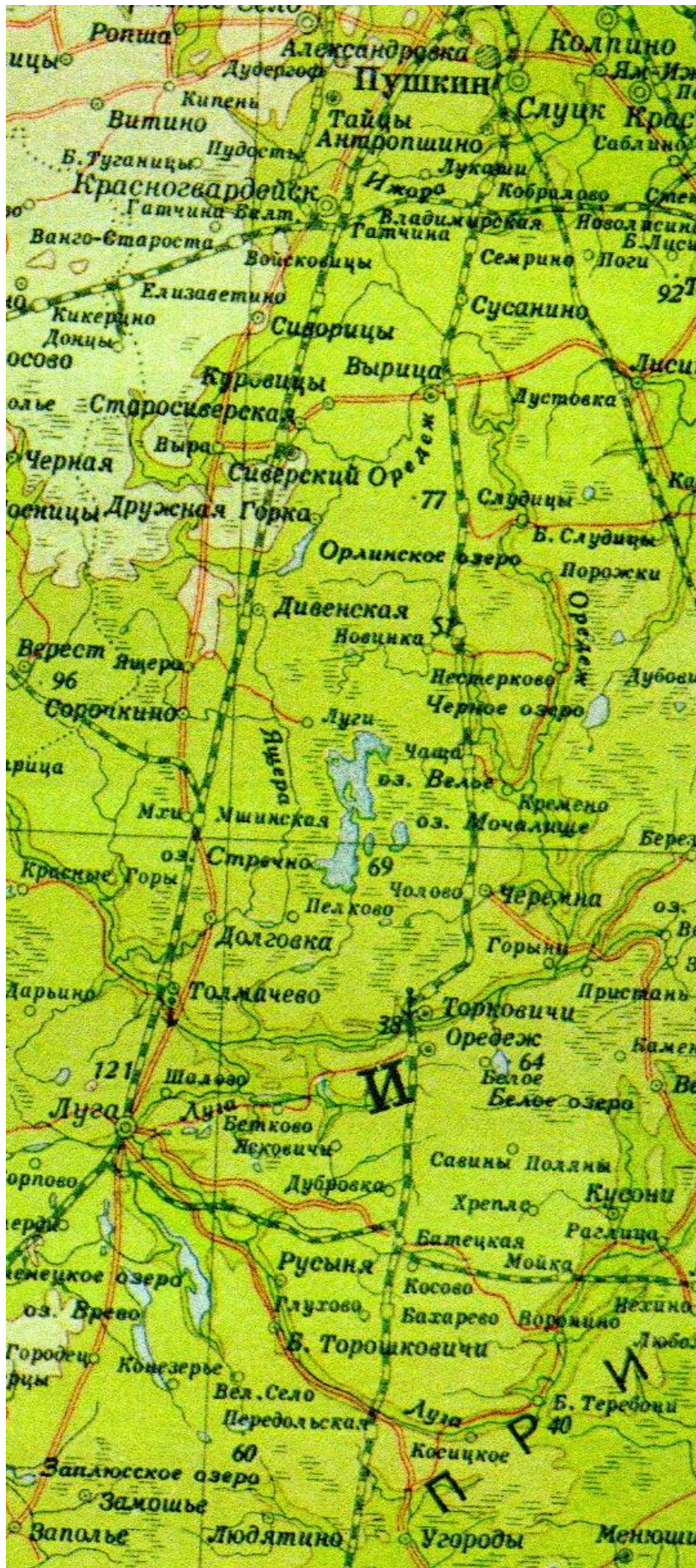
6. Карта района боевых действий Кировской дивизии народного ополчения [4].