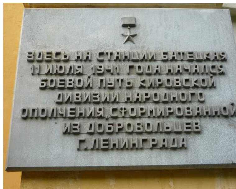
4. Памятная доска на станции Батецкая [12].