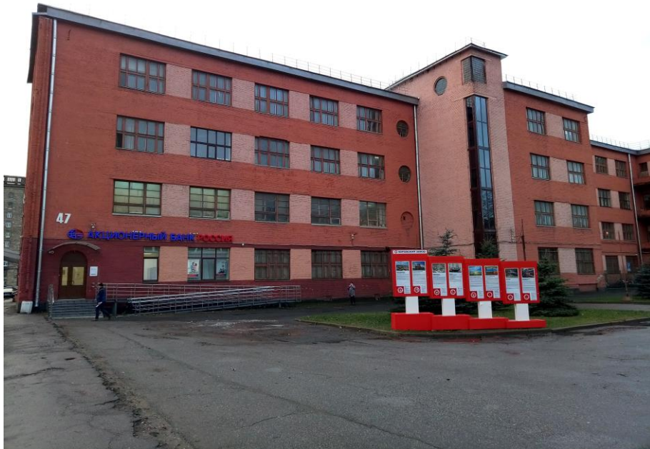
3. Здание ремесленного училища № 2 при Кировском заводе. Декабрь 2019 года. Фотография сделана во время экскурсии в музей Кировского завода.