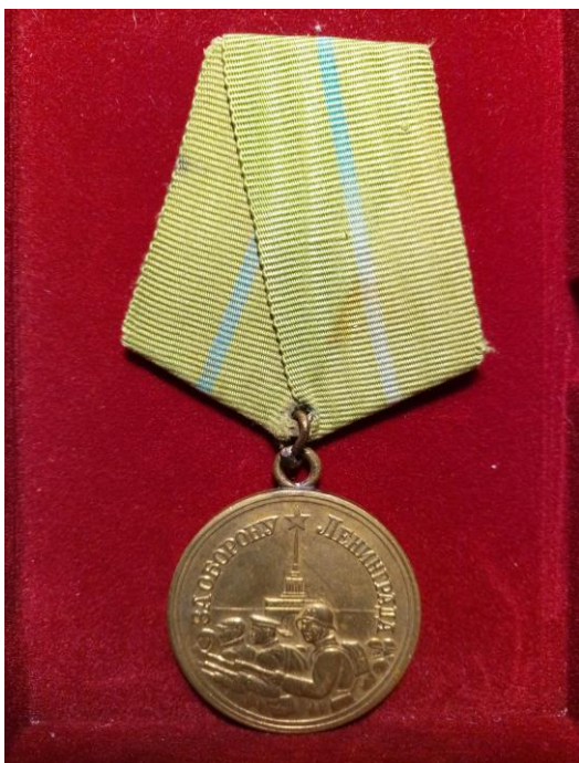
9. Медаль В.Ф. Бастова.