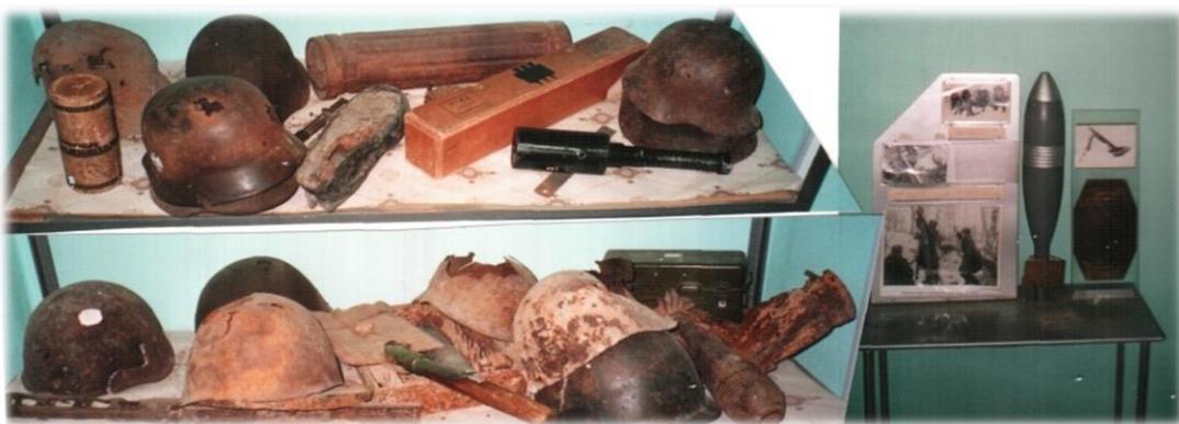
Основные фонды школьного музея Боевой Славы 175-го АЛМП, фото 2020г.