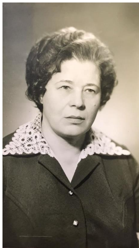
М.И. Кондратьева (Петрова), 1977 год