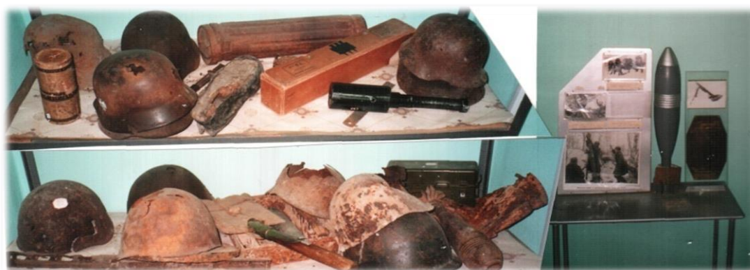
Основные фонды школьного музея Боевой Славы 175-го АЛМП, фото 2020г.