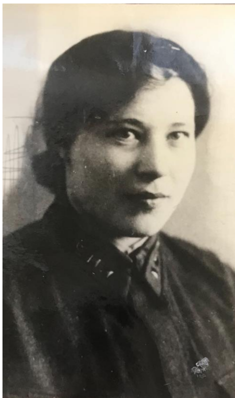
М.И. Кондратьева, 1942 год