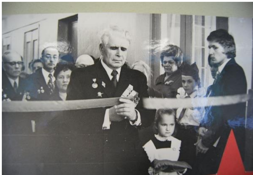
Открытие Зала Боевой славы 175-го АЛМП, 1975г.